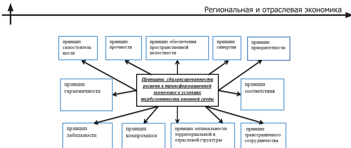
Рис. 12. Специфические принципы сбалансированного развития региона.