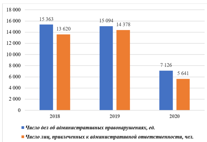
Рис. 2. Динамика отдельных статистических показателей по ст. 18.17 КоАП РФ 6

Fig. 2. Dynamics of individual statistical indicators according to Article 18.17 of the Administrative Code of the Russian Federation