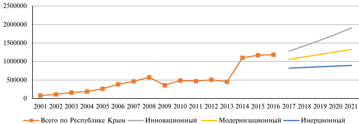
Рис. 2. Прогноз развития инвестиционного процесса в аграрном секторе Республики Крым

Fig. 2. The forecast of the investment process development in the agricultural sector of the Republic of Crimea