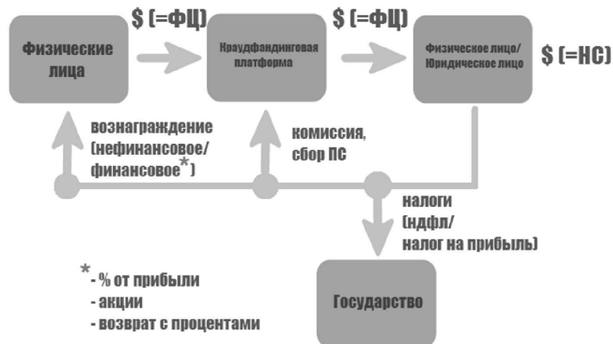
Рис. 2. Схема организации краудфандингового финансирования Fig. 2. Scheme of organizing crowd financing

Для определения цены краудфандинга рассчитывается размер финансовой цели. Финансовая цель – это сумма средств, которые необходимо собрать в течение установленного срока на краудфандинговой платформе. Она должна включать: